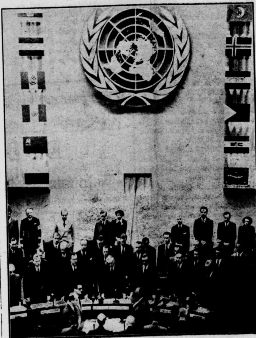
Para anggota Dewan Keamanan UNO yang bersidang tanggal 18 September diistana Chaillot di Paris telah berdiskusi sama menghe ningkan tjipta berhubung dengan tewasnja Pangeran Bernadotte dan Kol. Serot di Baitulmukaddis tanggal 17 September.